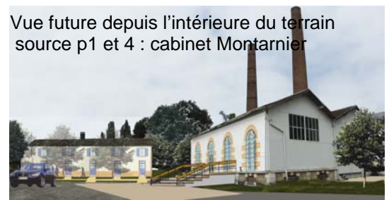
Vue future depuis l'intérieure du terrain source p1 et 4 : cabinet Montarnier

L'usine de la Socar, est un des rares exemples qu'il nous reste aujourd'hui, des premières installations industrielles, apparues dans la Grande Lande à la fin du XIXème siècle. C'est une part importante de la mémoire de notre territoire.